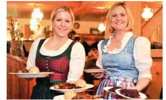
Das Martinigansl darf natürlich nicht fehlen