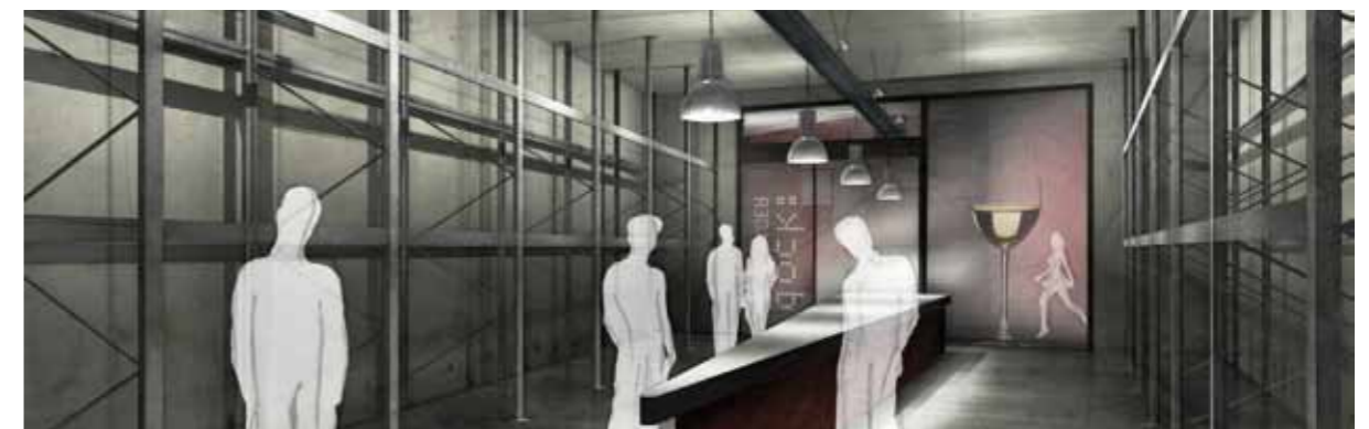
Im Lager können alle unsere Kunden die Weine nochmals begutachten und auch gleich mit nach Hause nehmen.