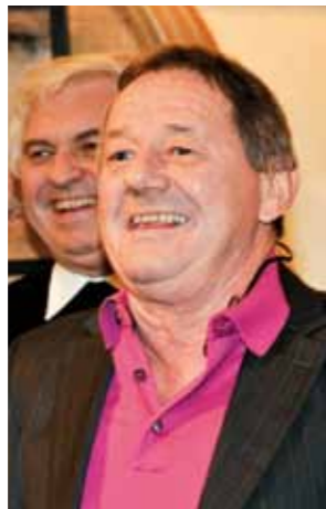
Wolfgang Ambros spricht über den Taufwein