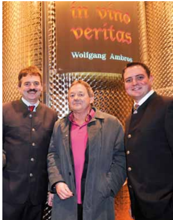
Alle sind stolz auf "In Vino Veritas"