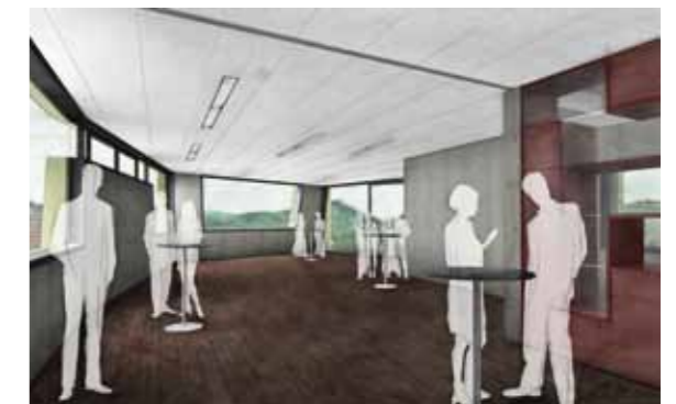
Der Veranstaltungsraum bietet ausreichend Platz für bis zu 100 Personen.