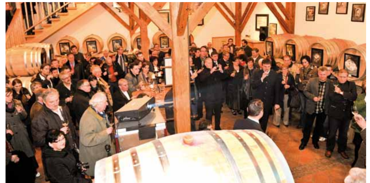
Erste Kostprobe des neuen Taufweines