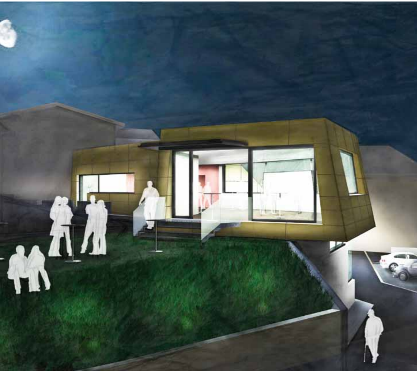
Der direkte Ausgang vom Veranstaltungsraum in unseren Vorgarten bietet einen tollen Ausblick auf das Stift Göttweig.