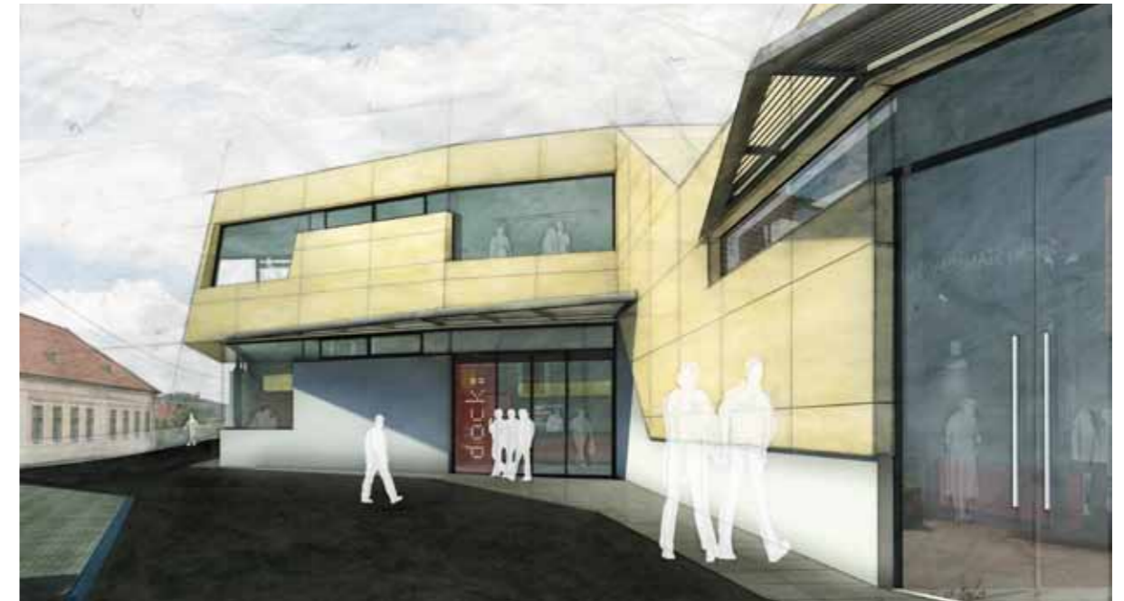
Der Haupteingang zu unserem Verkostungszentrum. Die beige Aussenfarbe erinnert an Löss.