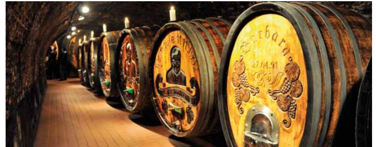
Unsere Fässer der letzten Taufweine

Fotos und Videos zum Abend gibt es auf unserer homepage zu sehen: www.dockner.at