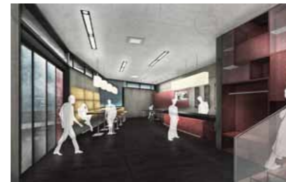
Der Verkaufs- und Verkostungsraum mit gemütlicher Sitzecke.