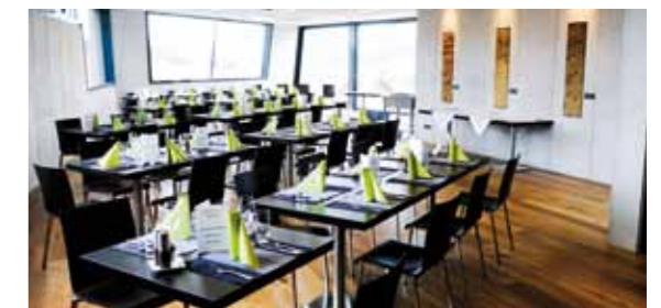
Unser wein.genuss-Göttweig Raum festlich aufgedeckt