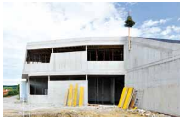
Baufortschritt Juni 2011