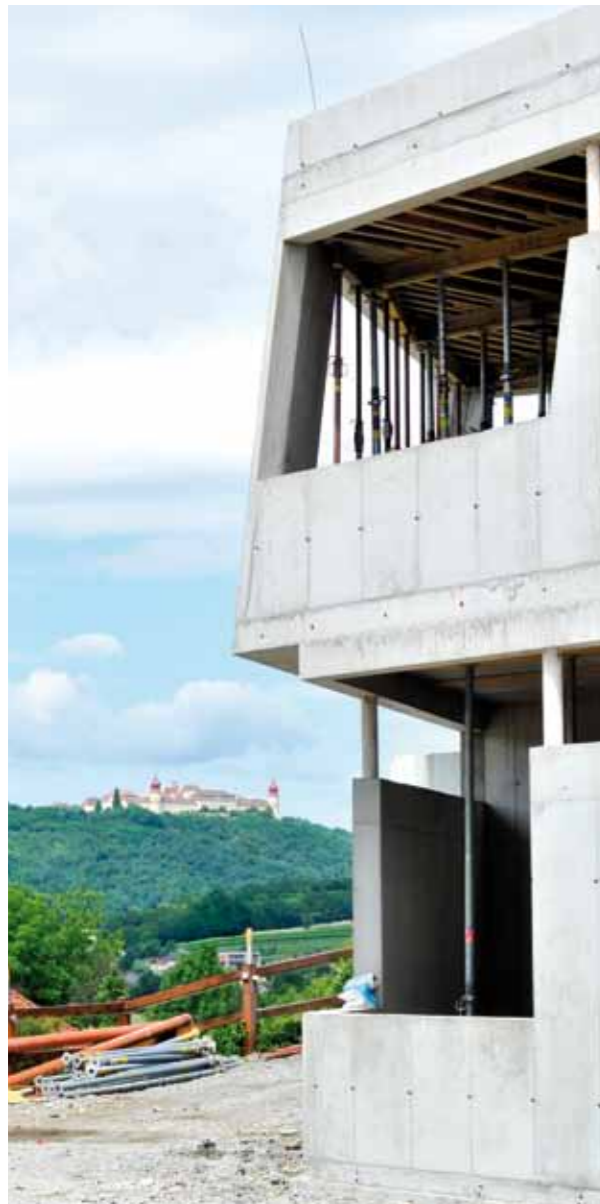
Ausblick auf Stift Göttweig

Im März dieses Jahres war der Spatenstich und schon haben wir die Dachgleiche unseres neuen Weinverkostungszentrums erreicht. Dank der tollen Witterung kann der Beton nun langsam trocknen und wir beginnen mit dem Innenausbau. Schon jetzt freuen wir uns sehr über den tollen Ausblick auf das Stift Göttweig, den wir von unserem neuen Seminar- und Genußraum genießen.