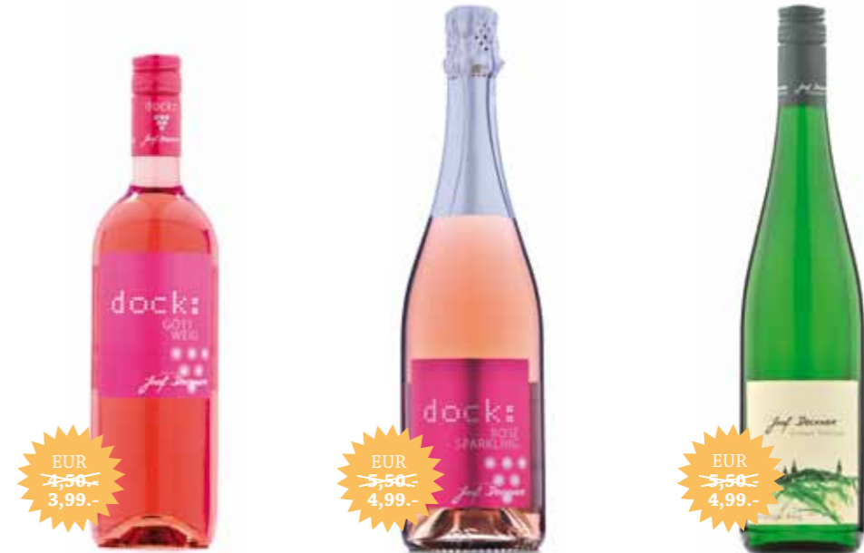
dock: GÖTTWEIG rosé

Ein sehr duftiger und fruchtiger Wein mit schöner Aromatik nach Erdbeere und Kirsche. Dieser Rosé besteht aus den drei Rotweinsorten: Zweigelt, Cabernet Sauvignon und Pinot Noir. Am Gaumen sehr elegant und mit einer frischen Säure ausgestattet. Durch die angenehme Fruchtsüße am Gaumen sehr harmonisch und trinkanimierend.