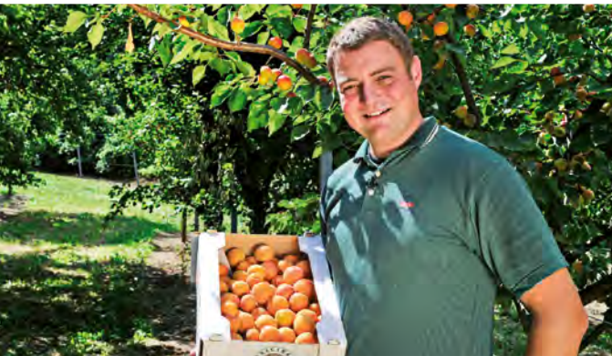
Unsere Marillen sind reif! Vorbestellung unter: 02736/7262-0

WIR HABEN FÜR SIE ZUM „ TAG DER OFFENEN KELLERTÜR “ EINIGE „SOMMERWEINE“ IN AKTION!