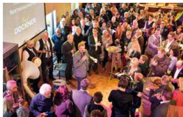
Ansprache von Sepp Dockner

Eintritt: € 99.- /Person 6 Gang-Menü mit Sekt- und Champagnerbegleitung