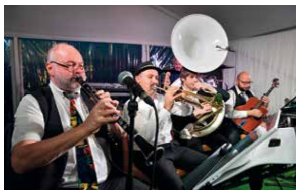
New Orleans Dixielandband