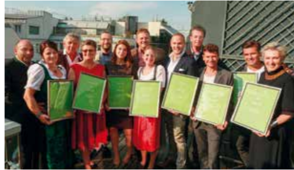
Siegerbetriebe von Österreich

Wir konnten heuer voller Stolz den Sonderpreis für die Auszeichnung „Bester Wein“ entgegen nehmen.