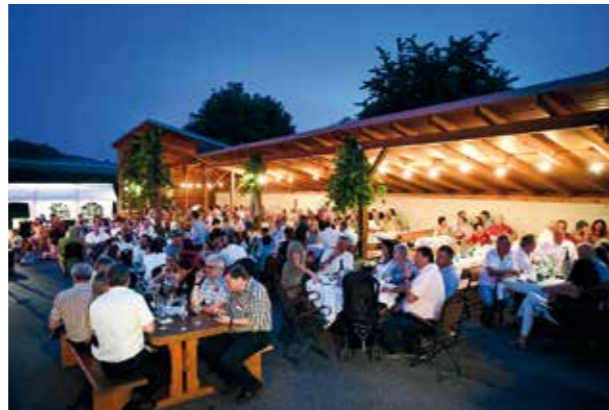
Beste Stimmung am Heurigenhof