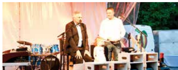
Verlosung der Großflaschen