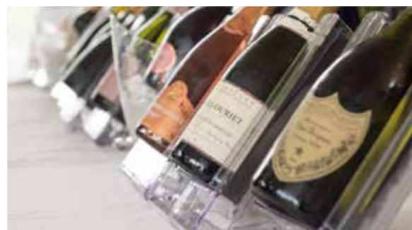
Die besten Champagner zum Verkosten