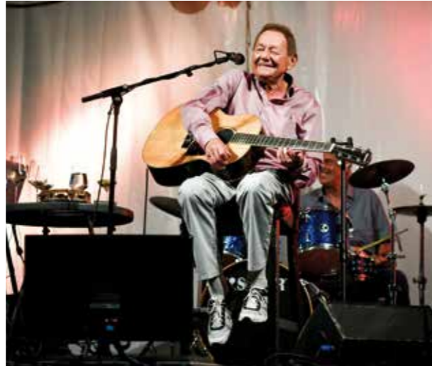
Mein lieber Freund Wolfgang Ambros