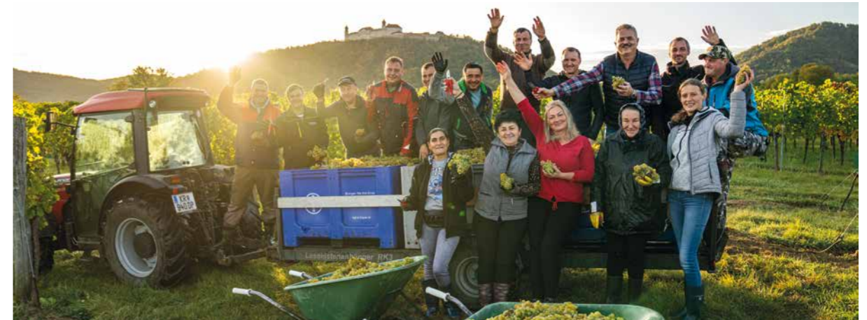
Strahlendes Wetter (wie an jedem Tag der Weinlese 2023) und eine strahlende Lesemannschaft.