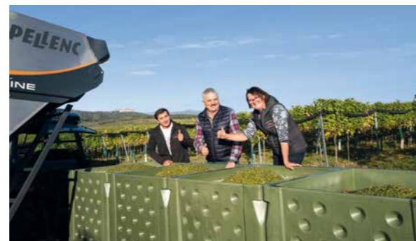
Rund 60 Prozent der Lese im Weingut Dockner erfolgt maschinell mit dem Traubenvollernter.