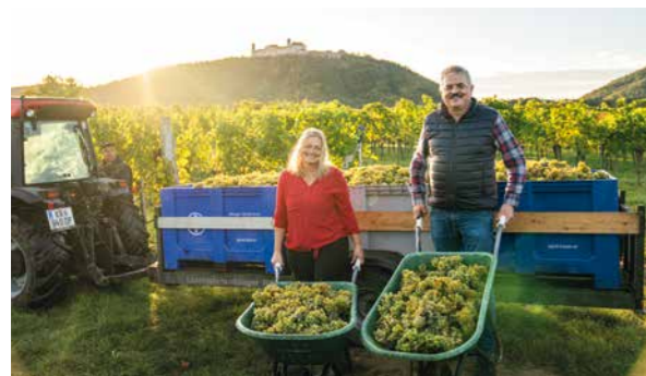
Zeigt her eure Trauben! Die können sich wirklich sehen lassen.