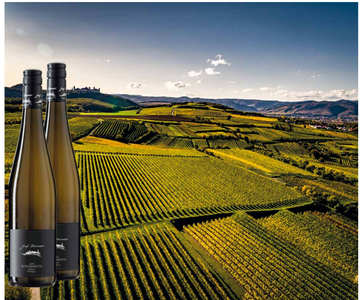
Eine der besten und bekanntesten Lagen des Weinguts Dockner: die Ried Rosengarten.

Was heute eine der schönsten Lagen des Weinguts Dockner ist, war einmal Meeresküste. Das ist allerdings gut 20 Millionen Jahre her.